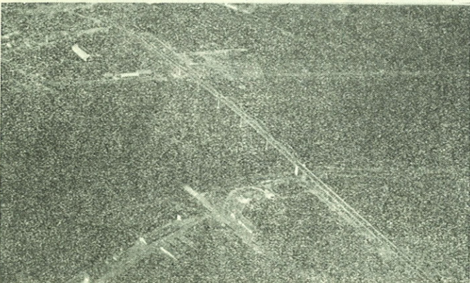
VILA FRANCA DE XIRA — Ponte Marechal Carmona

De colaboração com a Associação dos Antigos Alunos da Escola