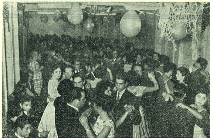
Aspecto da assistência

Estavam presentes cerca de 500 pessoas que dançaram animadamente durante a noite até às 5,30 da madrugada.