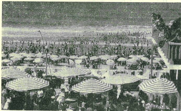
Piscina e Praia da Figueira da Foz